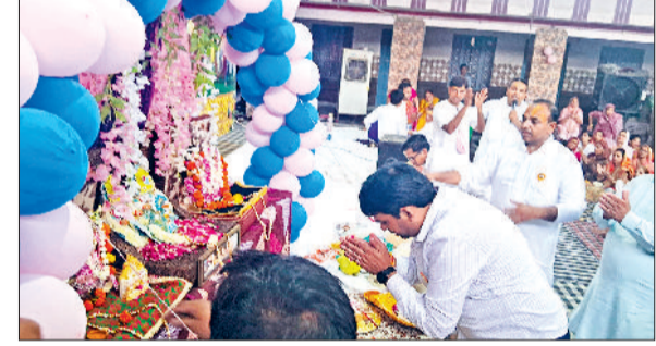
भगवान जगन्नाथ को प्रणाम कर रथयात्रा का शुभारंभ करते विधायक।