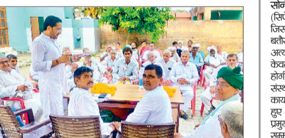
सोनीपत। बैठक के दौरान उपस्थित इनेलो नेता एवं पदाधिकारी।