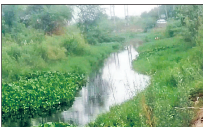
गन्नीर। ड्रेन की सफाई न होने के कारण भोगीपूर गांव में ड्रेन में उगी जलकुंभी व कबाड़।

उन्होंने बताया कि ड्रेन की सफाई न होने के कारण पानी जलकुंभी व कबाड़ उगने के कारण ड्रेन के साथ बने रास्ते पीछे से बरसात के पानी का दबाव बनने के कारण सारी जलकुंभी ओवरफ्लो होने