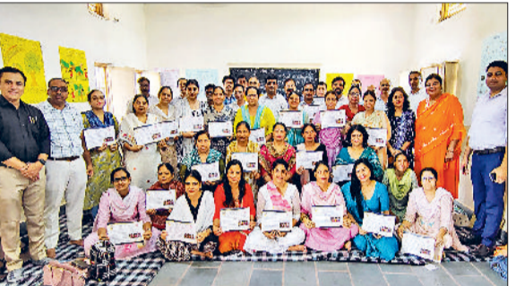
प्रशिक्षण शिविर के समापन अवसर पर प्रतिभागियों के साथ शिक्षा अधिकारी।

(एसएमसी) के तहत जारी किया गया यह बजट 5.23 लाख रुपये है। इन रुपयों से जिले के सभी ब्लॉकों में स्थित कुल 497 प्राथमिक और 201 वरिष्ठ माध्यमिक विद्यालयों में काम करवाया जाएगा। यह राशि स्कूलों में बुनियादी सुविधाओं, मरम्मत कार्य, साफ-सफाई और शैक्षणिक वातावरण सुधारने के लिए दी गई है। औसतन प्रत्येक प्राथमिक विद्यालय और वरिष्ठ माध्यमिक विद्यालय को 750 की दर से बजट स्वीकृत किया गया है। इसमें 101 प्राथमिक तथा 38 माध्यमिक स्कूल हैं। वहीं गोहाना ब्लॉक में 84 स्कूलों, कथूरा ब्लॉक में 45, खरखोदा में 84, मुंडलाना में 67, राई ब्लॉक में 112 स्कूलों को अनुदान मिलेगा।