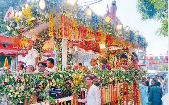
सोनीपत। भगवान जगन्नाथ रथयात्रा में शामिल श्रद्धालुगण।

कामी रोड स्थित बाबा धाम सिद्धपीठ मंदिर की ओर से भगवान जगन्नाथ महोत्सव के तहत भगवान जगन्नाथ रथयात्रा निकाली गई। भगवान जगन्नाथ, भाई बलभद्र व बहन सुभद्रा के साथ, बैट की भक्तिमय गांघ, ढोल-नगाड़ों व जयकारों के बीच रथ पर विराजमान होकर नगर भ्रमण के लिए निकले। शहरभर में धार्मिक व सामाजिक संस्थाओं के सदस्यों ने श्रद्धालुओं के साथ जगह-जगह रथयात्रा का स्वागत कर भगवान जगन्नाथ का दीदार किया। रथयात्रा से पहले ओडिशा के पुरी, वृंदावन, चंडीगढ़ व दिल्ली से आए