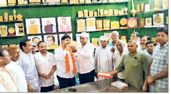
खरखोदा। मिठाई खिलाकर एमएलए आभार जताते गणमान्य।