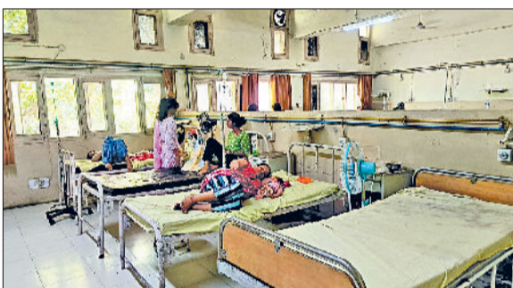
सोनीपत। वार्ड में भर्ती महिलाएं व सर्जरी वार्ड में भर्ती युवती खुद का कूलर लाए हुए, अलग-अलग बेड पर लेटी महिलाएं व खुद के लाए पंखे।

बता दें कि नागरिक अस्पताल में 200 बेड की सुविधा उपलब्ध है। प्रथम तल पर प्रबंधन की तरफ से आईसीयू वार्ड व सर्जिकल वार्ड तैयार किया गया है। सर्जिकल वार्ड में बेड की संख्या 50 की है। अस्पताल में बच्चों को जन्म देने वाली महिलाओं व उनके बच्चों को तीन दिन तक चिकित्सक की देखरेख में रखना होता है। वार्ड में भर्ती मरीजों को चिकित्सक के परामर्श व दवाओं से भले ही रात मिल रही हो, लेकिन सर्जिकल वार्ड में भर्ती मरीजों को उमस, और