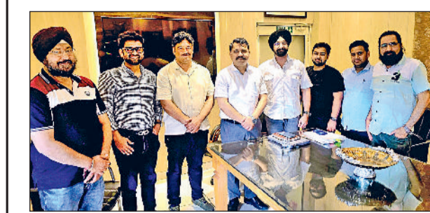
गन्नौर। एमएसएमई के अतिरिक्त संयुक्त निदेशक वीपीएस वालिया के साथ एमएसएमई औद्योगिक वेलफेयर एसोसिएशन के सदस्य।

बड़ी औद्योगिक क्षेत्र में एमएसएमई निदेशक ने उद्योगपतियों के साथ की बैठक हरिभूमि न्यूज ॥ गन्नौर