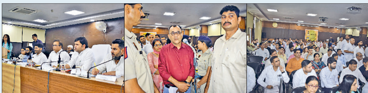
सोनीपत। बैठक के दौरान मंच पर उपस्थित मंत्री, विधायक, उपायुक्त एवं अन्य अधिकारियों, बैठक में अपनी शिकायत रखते हुए एक फरियादी, बैठक में उपस्थित अधिकारियों।

शिकायतों में से राज्यमंत्री ने त्वरित कार्रवाई करते हुए 18 शिकायतों को मौके पर ही समाधान किया और 5 शिकायतों के समाधान को लेकर अधिकारियों को निर्देश दिए कि इन शिकायतों का समाधान अगली बैठक तक हो जाना चाहिए। उन्होंने अधिकारियों को सख्त निर्देश दिए कि वे अपनी ड्यूटी का ईमानदारी से निर्वहन करते हुए लोगों की शिकायतों का तुरंत समाधान करने का प्रयास करें ताकि लोगों को झंझर उधर चक्कर न काटने पड़े।