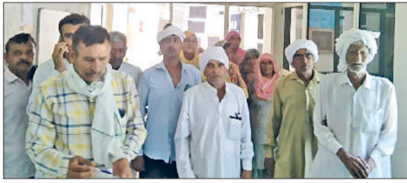
गन्नीर। एसडीएम कार्यालय में ज्ञापन देने पहुंचे बजाना गांव के ग्रामीण।