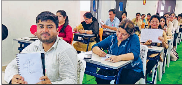
गोहाना। विभिन्न समसामयिक विषयों की रचनात्मक गतिविधियों में प्रतिभागिता करते हुए शिक्षकगण।

तेज रफ्तार वाहन की टक्कर से युवक की मौत सोनीपत। राष्ट्रीय राजमार्ग संख्या-44 पर तेज रफ्तार का कहर देखने को मिला। तेज रफ्तार अज्ञात वाहन ने सड़क पार कर रहे युवक को चपेट में ले लिया। हादसे के बाद वाहन चालक फरार हो गया। राहगीरों ने मामले की सूचना पुलिस को दी। पुलिस ने मौके पर पहुंचकर शव को कब्जे में लेकर नागरिक अस्पताल में भिजवाया है। पुलिस मृतक की पहचान के प्रयास कर रही है। कुंडली थाने में तैनात व मामले में जांच अधिकारी कुलदीप ने बताया कि देर रात सूचना मिली थी कि गांव जाटी कलां मोड़ के सामने दिल्ली-पानीपत सड़क मार्ग पर युवक का शव पड़ा हुआ है। सूचना के बाद पुलिस टीम मौके पर पहुंची। प्रारंभिक जांच में सामने आया कि युवक सड़क हादसे का शिकार हुआ है।